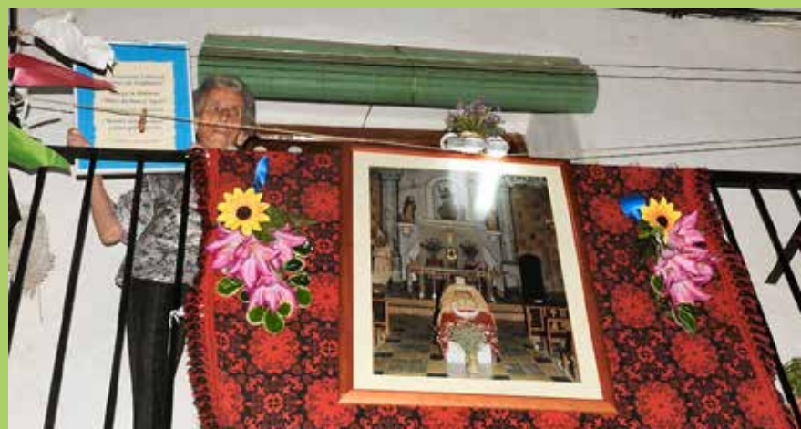
"Mingueta", premi al millor balcó