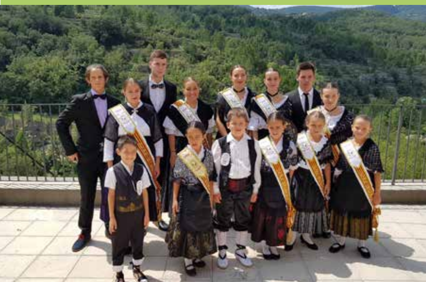
Cort de festes 2018 molt templada