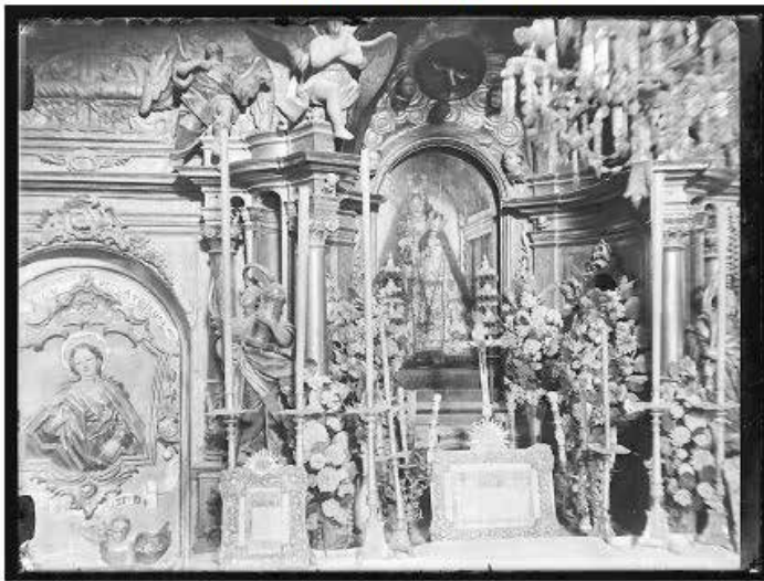
Retaule església parroquial, any 1697