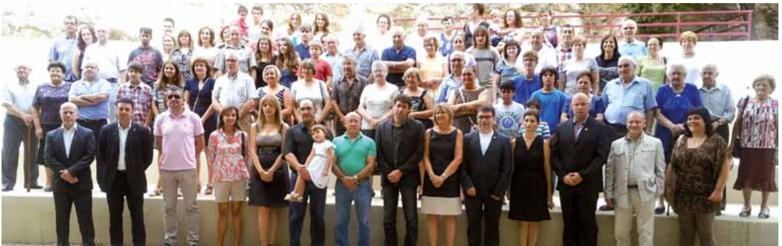
La Sènia dedicà un dia de les seues festes als vallibonencs que hi viuen