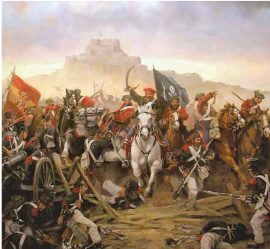
Quadre de Ferrer Dalmau sobre "la rotura del cerco de Morella por Cabrera" (1ª guerra carlista).

Trobem les primeres defuncions de voluntaris Carlistes amb enterraments gratis: