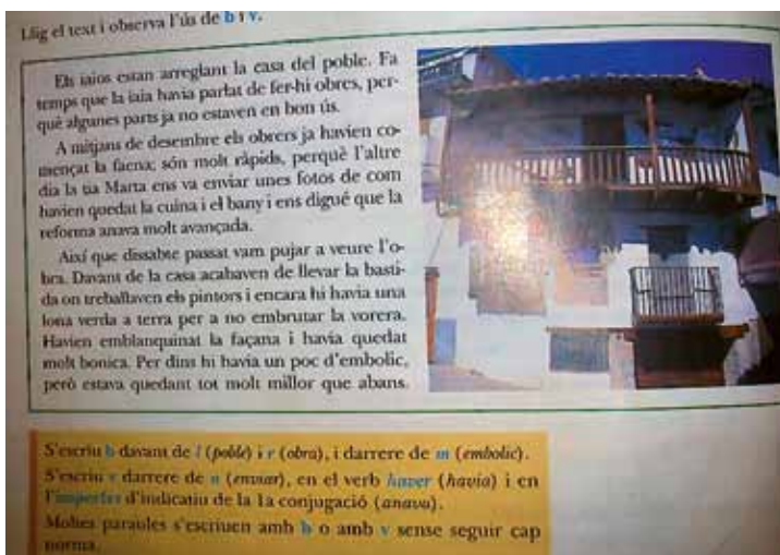
Un llibre de sisè de Primària inclouïa una foto de Vallibona