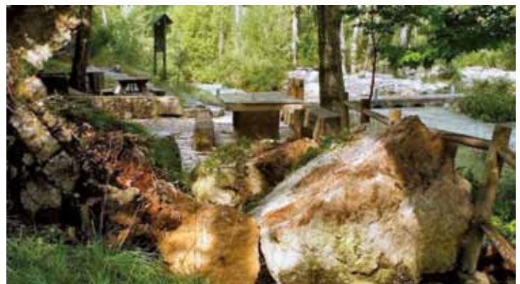
Despreniments a la Font Fresca arran de la tempesta de l'1 de juliol